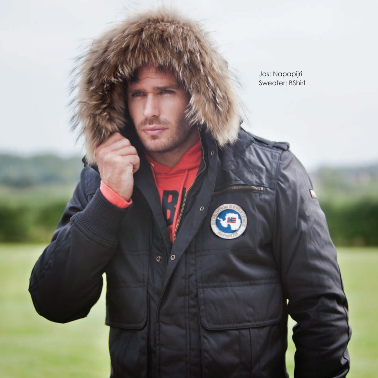
Jas: Napapijri Sweater: BShirt