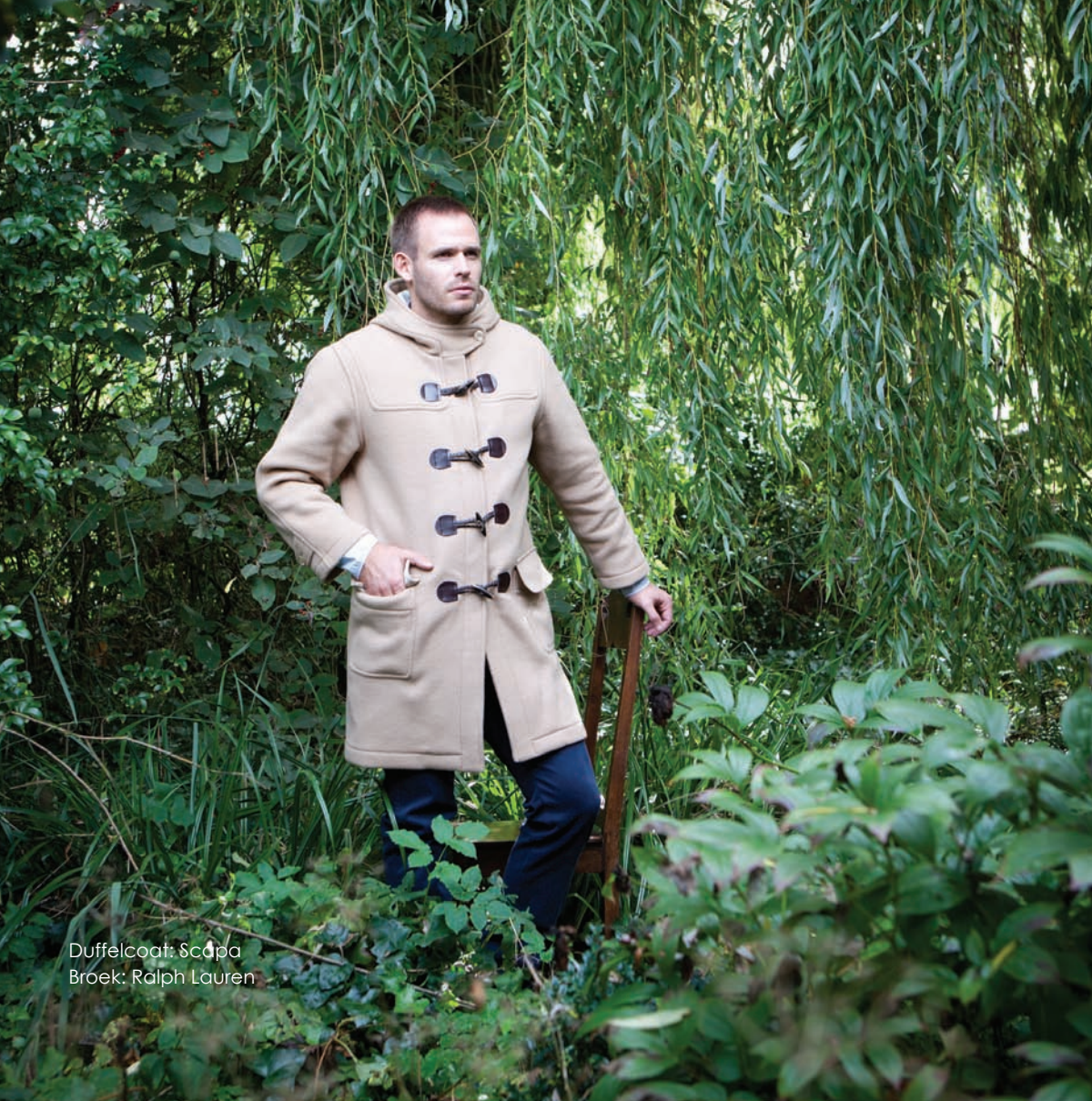
Duffelcoat: Scapa Broek: Ralph Lauren