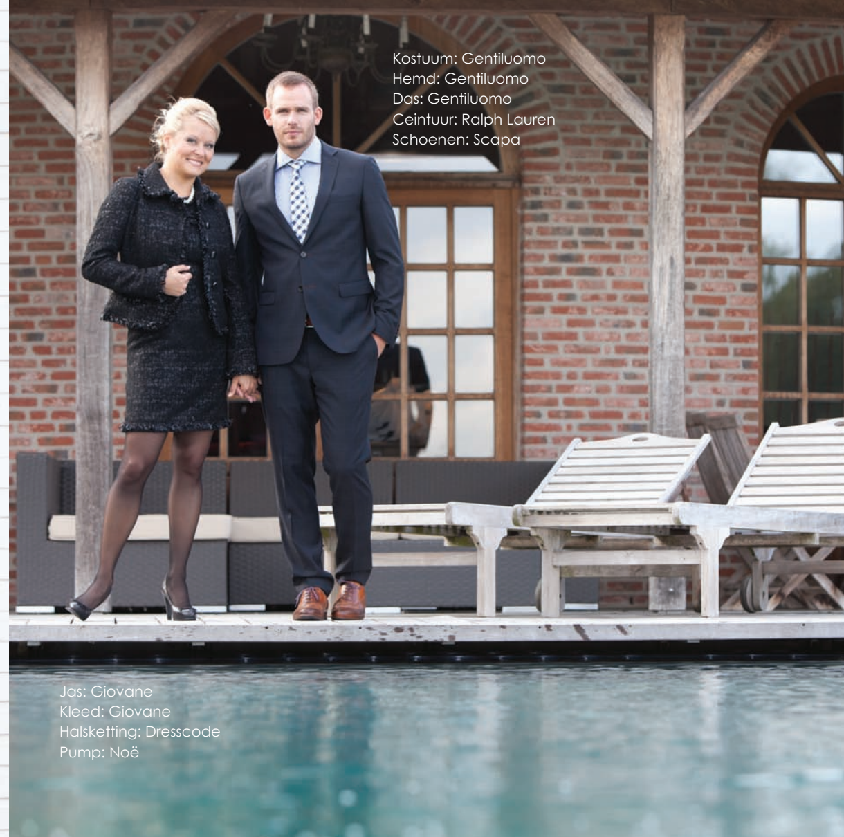
Kostuum: Gentiluomo Hemd: Gentiluomo Das: Gentiluomo Ceintuur: Ralph Lauren Schoenen: Scapa