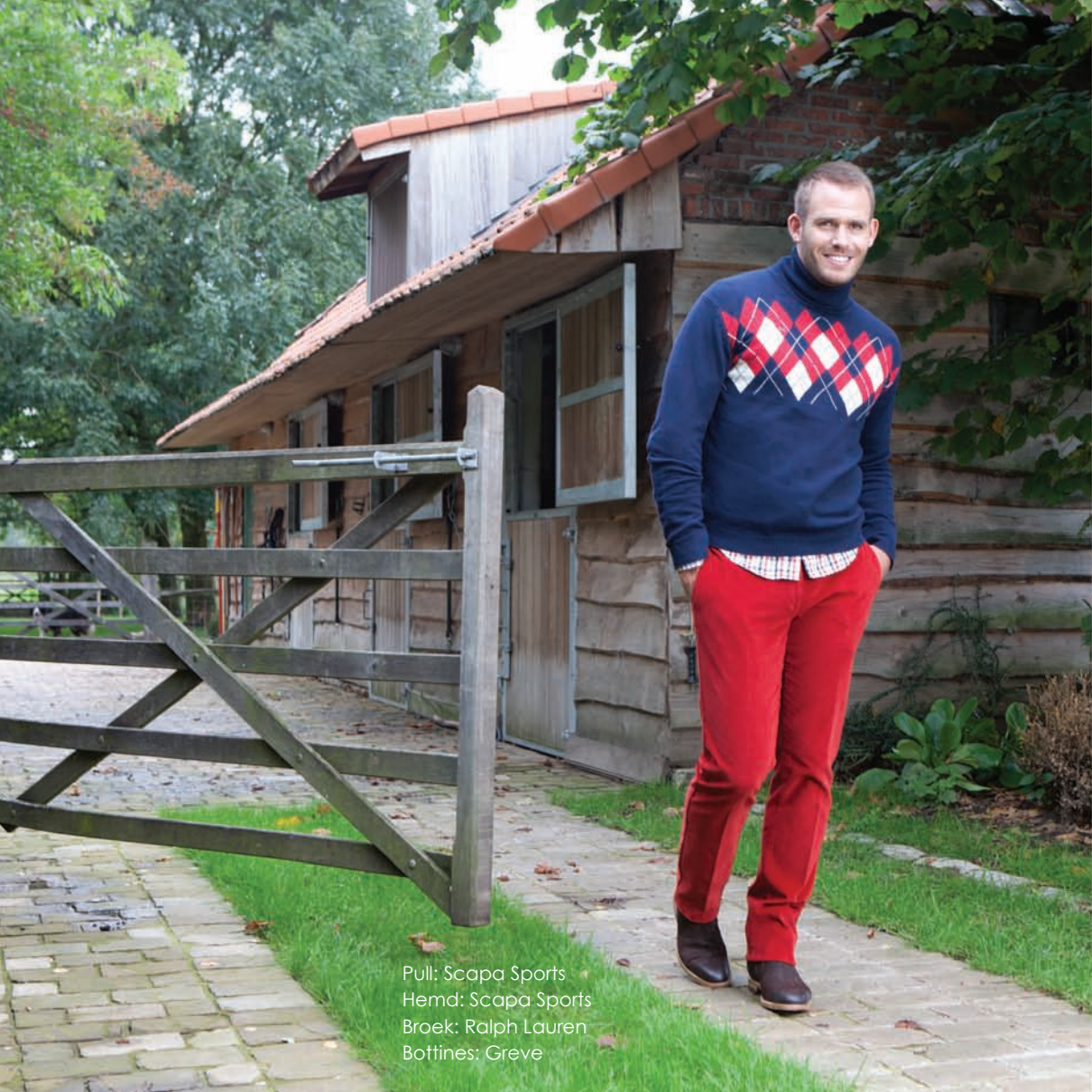
Pull: Scapa Sports Hemd: Scapa Sports Broek: Ralph Lauren Bottines: Greve