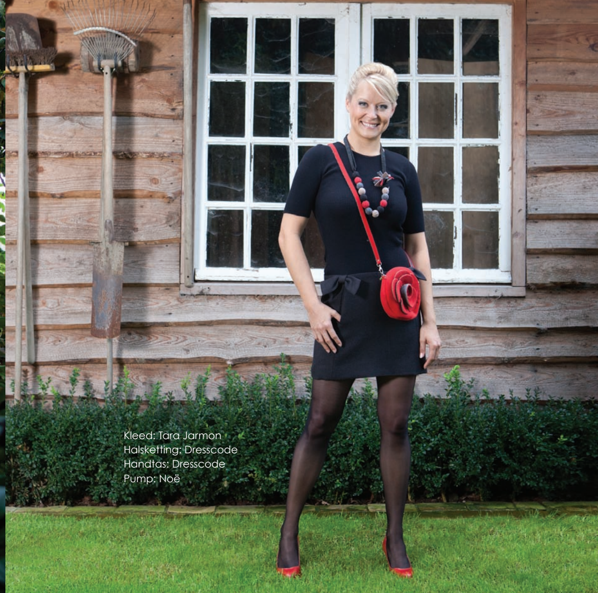
Kleed: Tara Jarmon Halsketting: Dresscode Handtas: Dresscode Pump: Noë