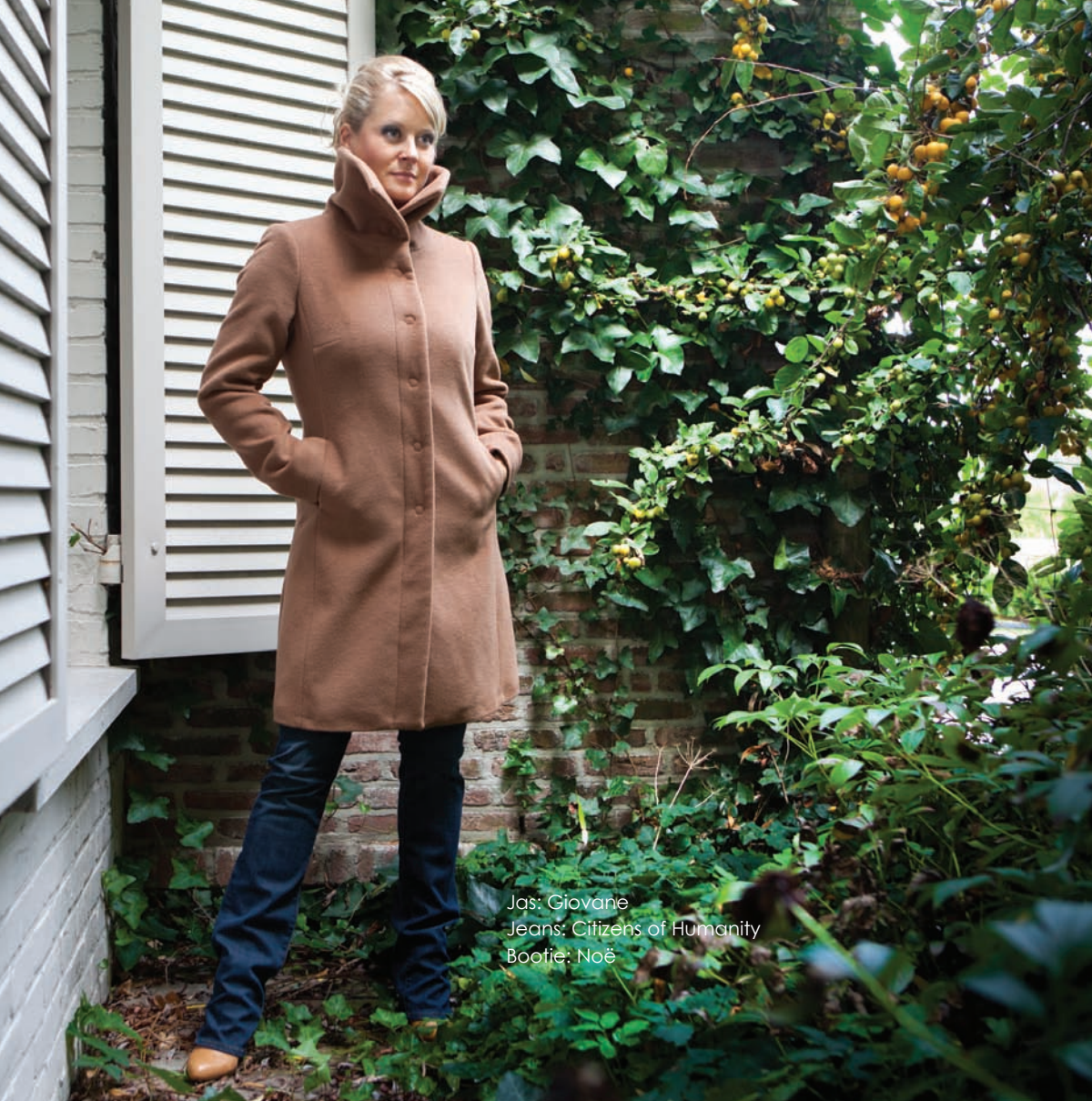
Jas: Giovane Jeans: Citizens of Humanity Bootie: Noë