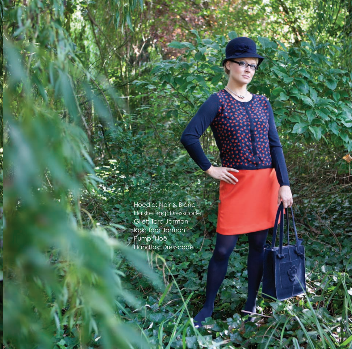
Hoedje: Noir & Blanc Halsketting: Dresscode Gilet: Tara Jarmon Rok: Tara Jarmon Pomp: Noë Handtas: Dresscode