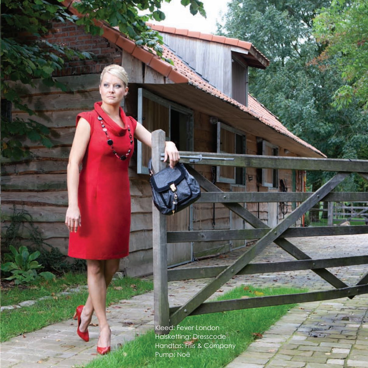
Kleed: Fever London Halsketting: Dresscode Handtas: Fris & Company Pump: Noë