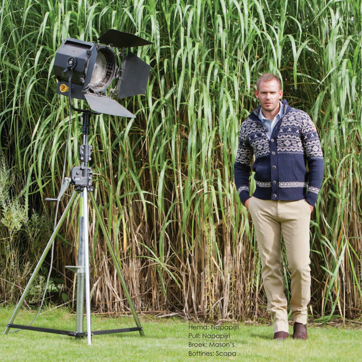
Hemd: Napapijri Pull: Napapijri Broek: Mason's Bottines: Scapa