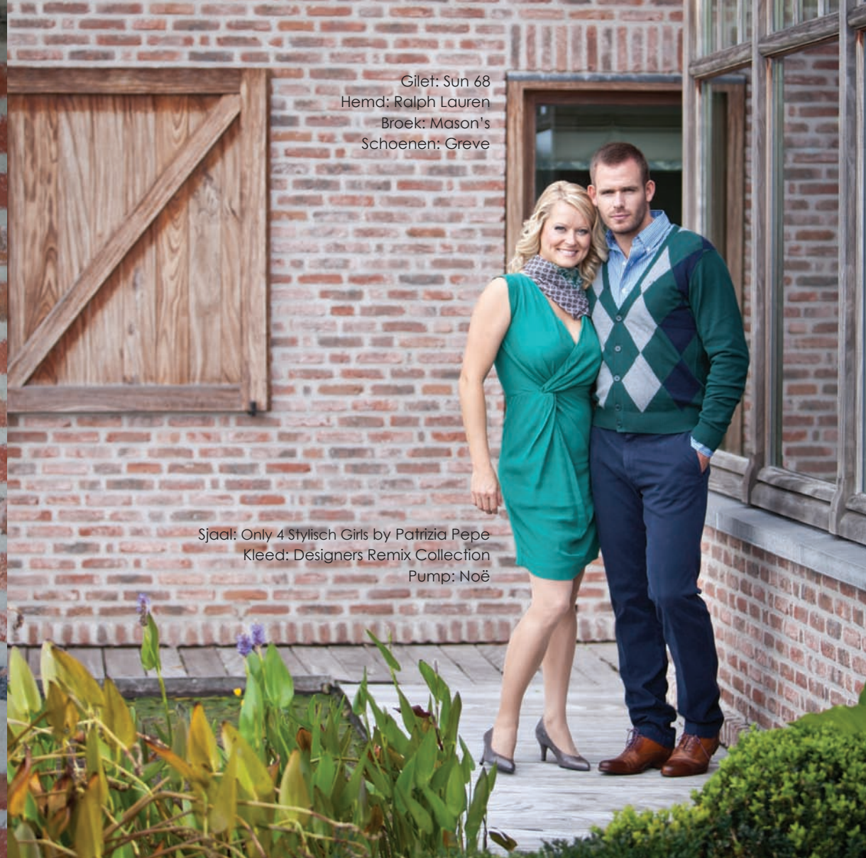
Gilet: Sun 68 Hemd: Ralph Lauren Broek: Mason's Schoenen: Greve