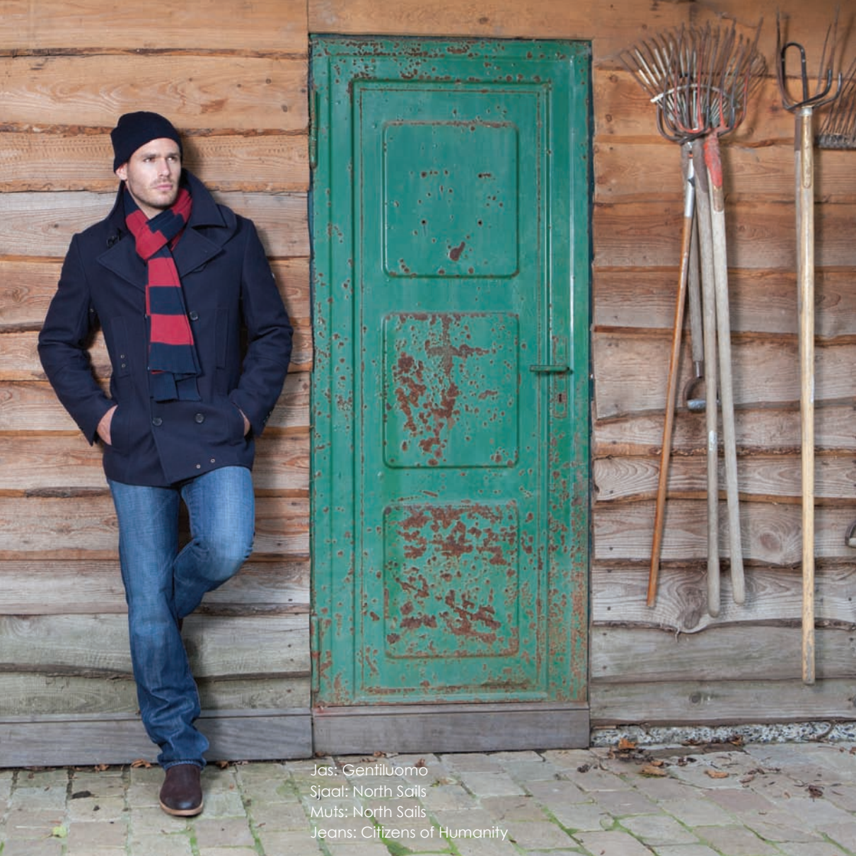
Jas: Gentiluomo Sjaal: North Sails Muts: North Sails Jeans: Citizens of Humanity