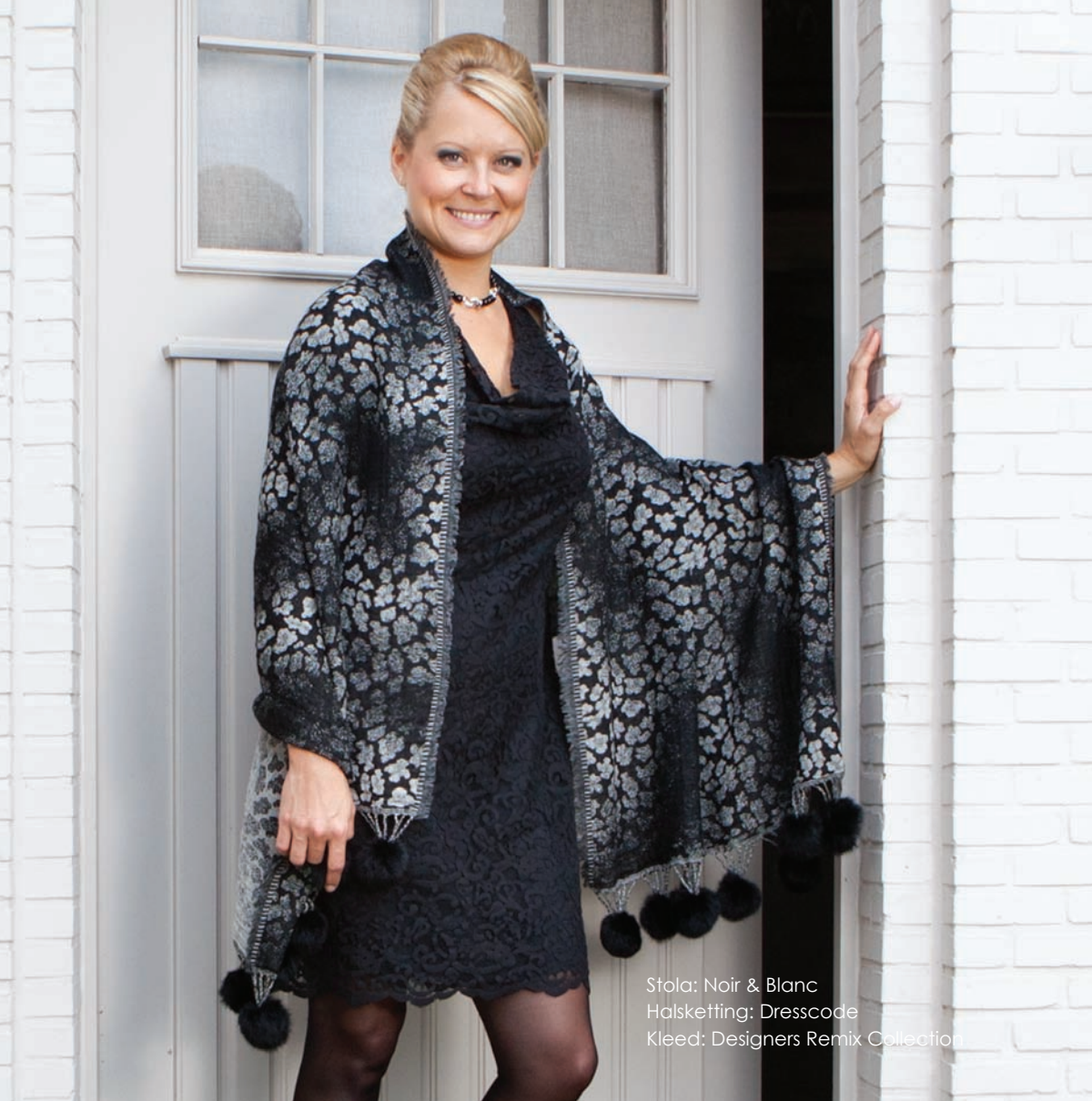
Stola: Noir & Blanc Halsketting: Dresscode Kleed: Designers Remix Collection